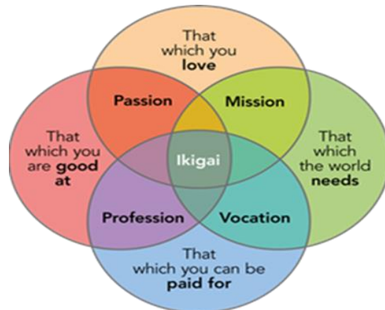
Afbeelding 1; de 4 Ikigai- hoofdvragen